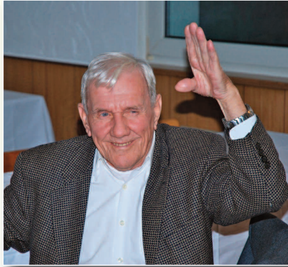
unserem Förderverein ist, herzlich für diese tolle Unterstützung!

An unserem Vereinsheim ist der Innenausbau in vollem Gange, die Wände der neuen Räumlichkeiten stehen und die Installation von Strom, Gas und Wasser wird von den beauftragten Firmen derzeit durchgeführt. Die Küchenplanung läuft auf Hochtouren und dank einer großzügigen Spende von Karl-Heinz Schmeller, der uns 2.000,- € für die Kücheneinrichtung gespendet hat, können wir eine optimale Lösung schaffen. Wir danken Karl-Heinz, der das älteste Mitglied in