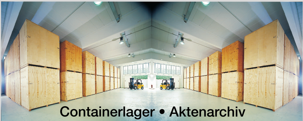
Containerlager • Aktenarchiv

Ob "um die Ecke oder um die Welt", innerhalb der Stadt, innerhalb Europas oder zu einem anderen Kontinent, ob ein einziges Möbelstück versetzt oder ein kompletter Haushalt verlegt werden soll, ob Single oder Großfamilie, ob Privat- oder Büroumzug- wir möchten in jedem Fall Ihr Ansprechpartner in Sachen Umzug sein.